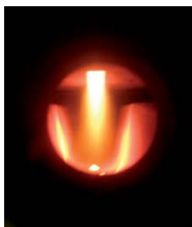
Tehnica de ardere prin gazeificare la Vitoligno 100-S

Cazanul cu funcționare pe principiul gazeificării lemnului Vitoligno 100-S se impune prin robustețe și prin confortul conferit de sistemul de automatizare Vitotronic